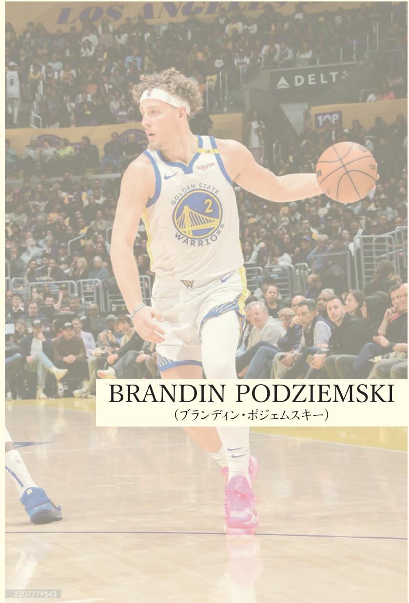
BRANDIN PODZIEMSKI (ブランディン・ポジェムスキー)