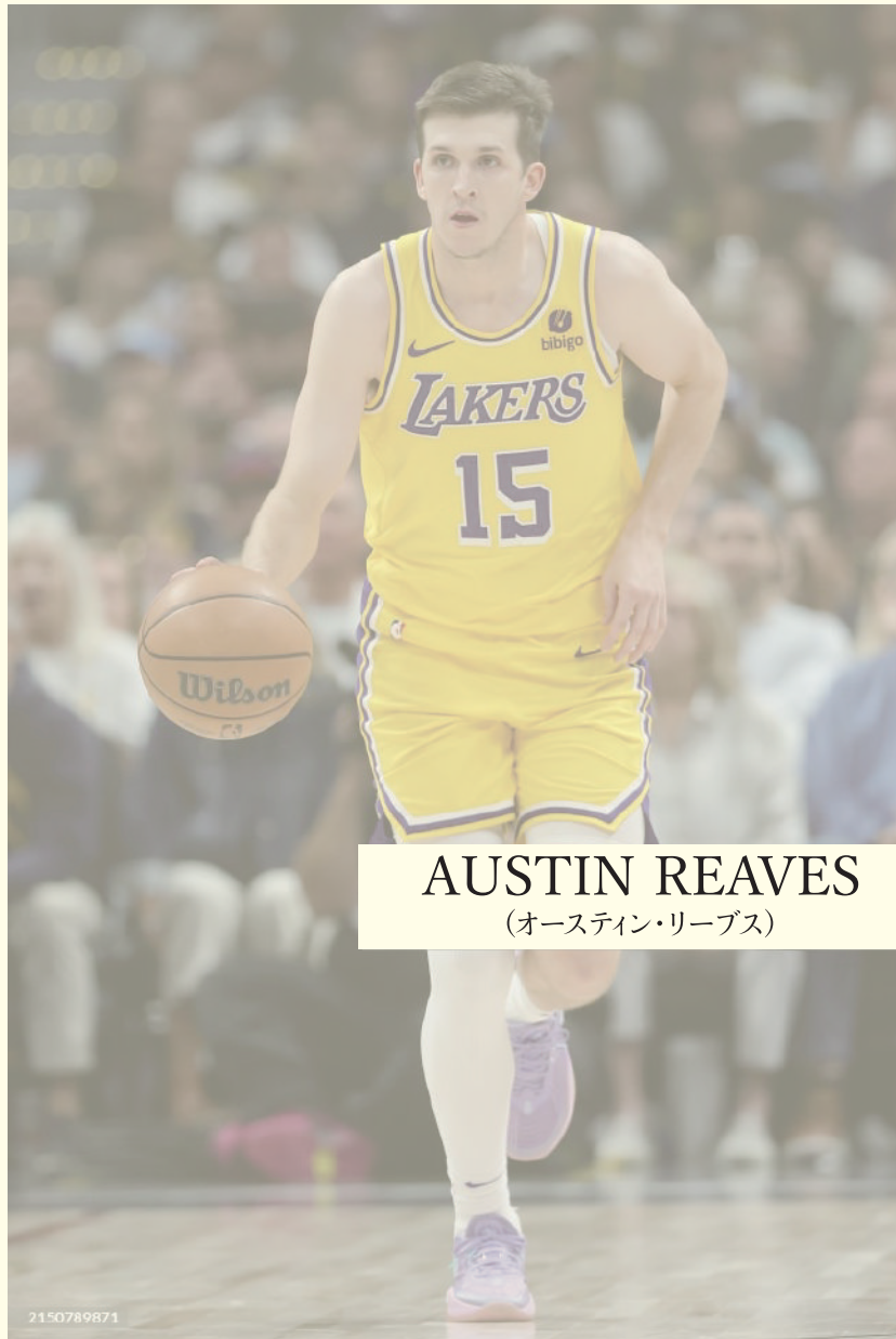
AUSTIN REAVES (オースティン・リーブス)

中国を拠点に活動するスポーツアパレルブランド。 中国国内だけでなく世界が注目するブランドの1つであり、 現在はNBA選手2名とサプライヤー契約を結んでいる。